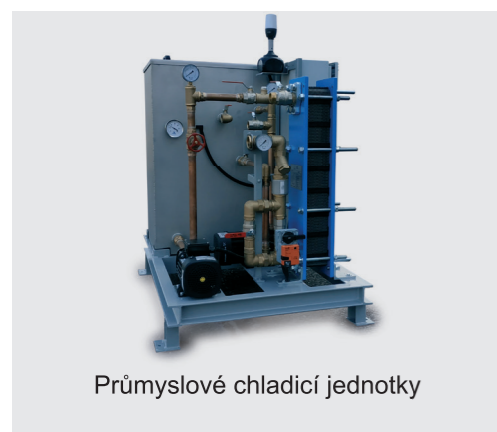
Průmyslové chladicí jednotky