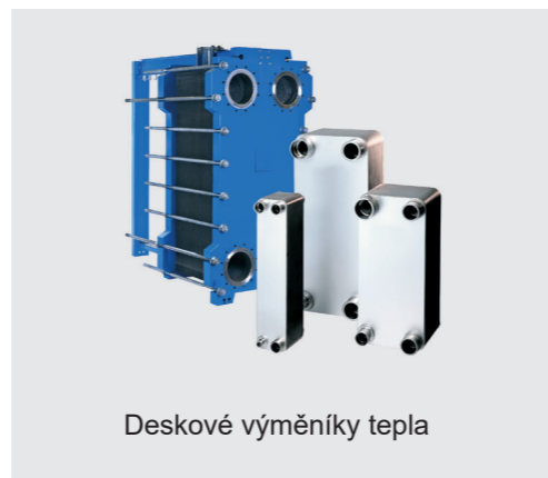
Deskové výměníky tepla