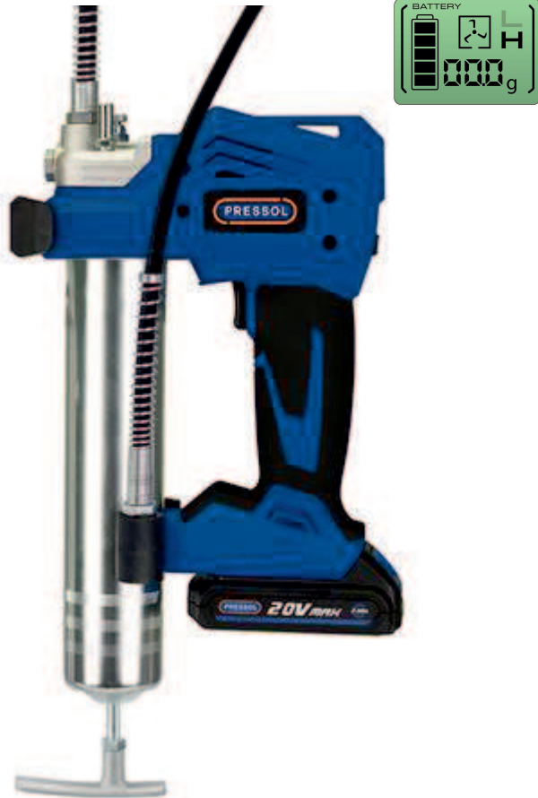
Akumulátorový mazací lis Pressol 20 V-2000 mAh

Zapsán do obchodního rejstříku u Krajského soudu v Ústí nad Labem v oddíle C, č. vložky 274